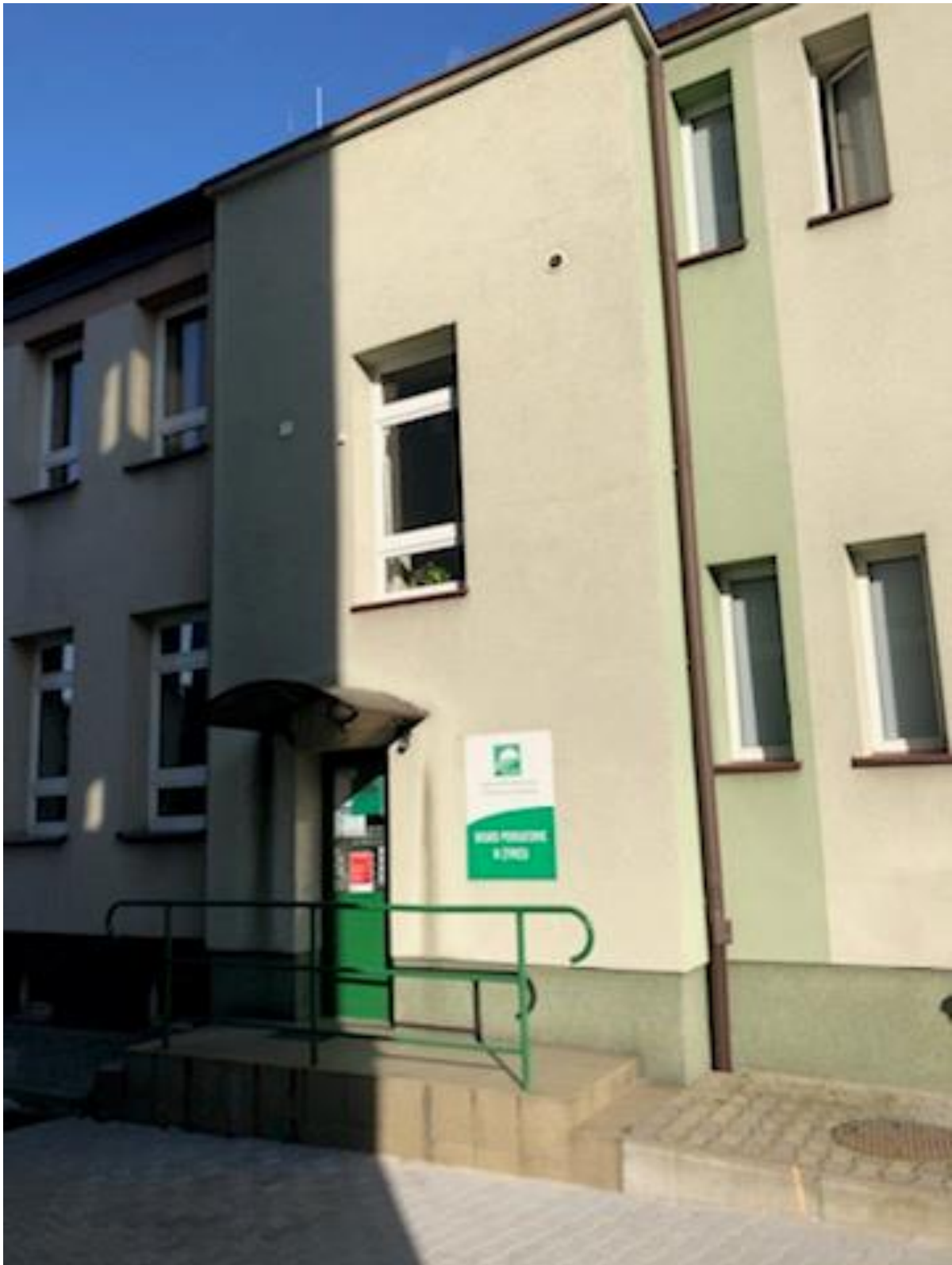
Wejście do budynku od strony dziedzińca

Budynek posiada dwa wejścia jedno główne od strony ulicy a drugie od strony dziedzińca. Wejście główne do budynku jest na poziomie chodnika, następnie wewnątrz należy pokonać sześć stopni. Przy wejściu od strony dziedzińca należy